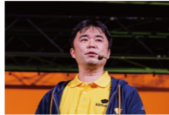
kintone Evangelist 在籍

ノーコードで自分たちで業務システムが作れるkintoneですが、全てを実現することはできません。少し高度な部分は、私たちにお任せください。カミノバにはサイボウズ公認の資格を持つ技術者や優秀なスタッフ、そして今まで培ってきた経験とノウハウがあります。確かな技術力で、お客様の願いを最適なカタチで叶えることができます。