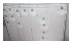
ホワイトボードで行っていた 工程管理

今まで、エイティーシー様では修理情報や作業進捗をすべて紙やホワイトボードに手書きで共有していたため、同じ敷地内でもその場所に行かないと確認することができず、現場で作業をしているととても不便に感じていました。